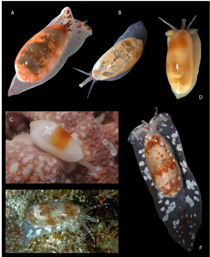
Figura 1. Ejemplares vivos de: A-B) Volvarina morrocoyensis , Caballer, Espinosa & Ortea, especie nueva, A. holotipo, B. paratipo 3, C) Volvarina monchoi Caballer, Espinosa & Ortea, especie nueva, holotipo. D) Volvarina avesensis Caballer, Espinosa & Ortea, especie nueva, holotipo. E-F) Hyalina nelsyae especie nueva, E. vista lateral, F. vista dorsal / Living specimens of: A-B) Volvarina morrocoyensis , Caballer, Espinosa & Ortea, new species, A. holotype, B. paratype 3, C) Volvarina monchoi Caballer, Espinosa & Ortea, new species, holotype, D) Volvarina avesensis Caballer, Espinosa & Ortea, new species, holotype. E-F) Hyalina nelsyae , new species, E. lateral view, F. dorsal view

localidad tipo (23/03/2010); ejemplar (3,4 x 1,65 mm) recolectado vivo, preservado en alcohol y depositado en SOM-IVIC (IVICCMT013). Paratipo 2: Los Juanes (10°51'54,92"N; 68°13'0,01"O), PNM, Venezuela (23/03/2010); ejemplar (6,95 x 3,4 mm) recolectado vivo en una entrada al sistema lagunar rodeada de mangle rojo, en fondo de arena con Halimeda spp. a 2 m de profundidad, preservado en seco y depositado en SOM-IVIC (IVICCMT014). Paratipo 3: entrada cercana a Boca Grande (10°51'49,10"N; 68°13'16,20"O), PNM, Venezuela (24/03/2010); ejemplar (7,1 x 3,37 mm) recolectado vivo en una laguna costera rodeada de mangle rojo, en fondo arenoso-fangoso con Caulerpa spp. a 1 m de profundidad, preservado en seco y depositado en FUDENA (CFPNN0003).